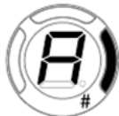
Ton „a“ zu hoch gestimmt