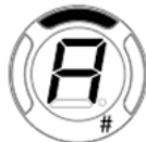
Ton „a“ Stimmung ok